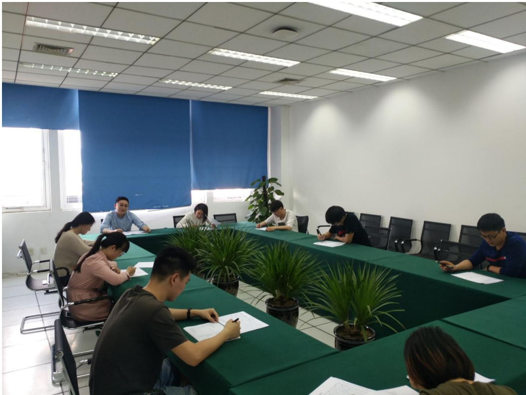
图 6. 郑州大学网络安全技能大赛初赛现场