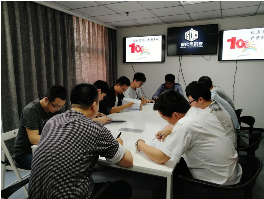
图 8. 郑州赛欧思科技有限公司网络安全技能大赛初赛现场