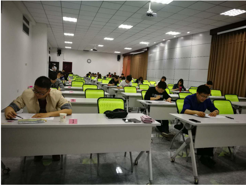
图 2. 中国联合网络通信有限公司河南省分公司网络安全技能大赛初赛现场