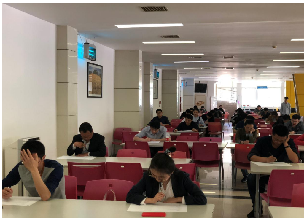
图1. 中国移动通信集团河南有限公司网络安全技能大赛初赛现场

河南省“天安杯”网络安全技能大赛自3月20日启动后，省各基础电信运营公司、省铁塔公司及相关互联网企业高度重视，积极行动，全省257人参加了大赛组委会组织的网络安全法律法规及技术知识培训。各参赛单位第一时间下发文件，充分发动，自行组织宣贯、学习、交流《网络安全法》、相关法律法规政策标准及网络安全技术知识，组织网络安全攻防演练。掀起了学法、用法、守法及网络安全技能大赛大比武的高潮。截止4月30日，全省341人参加了大赛初赛。