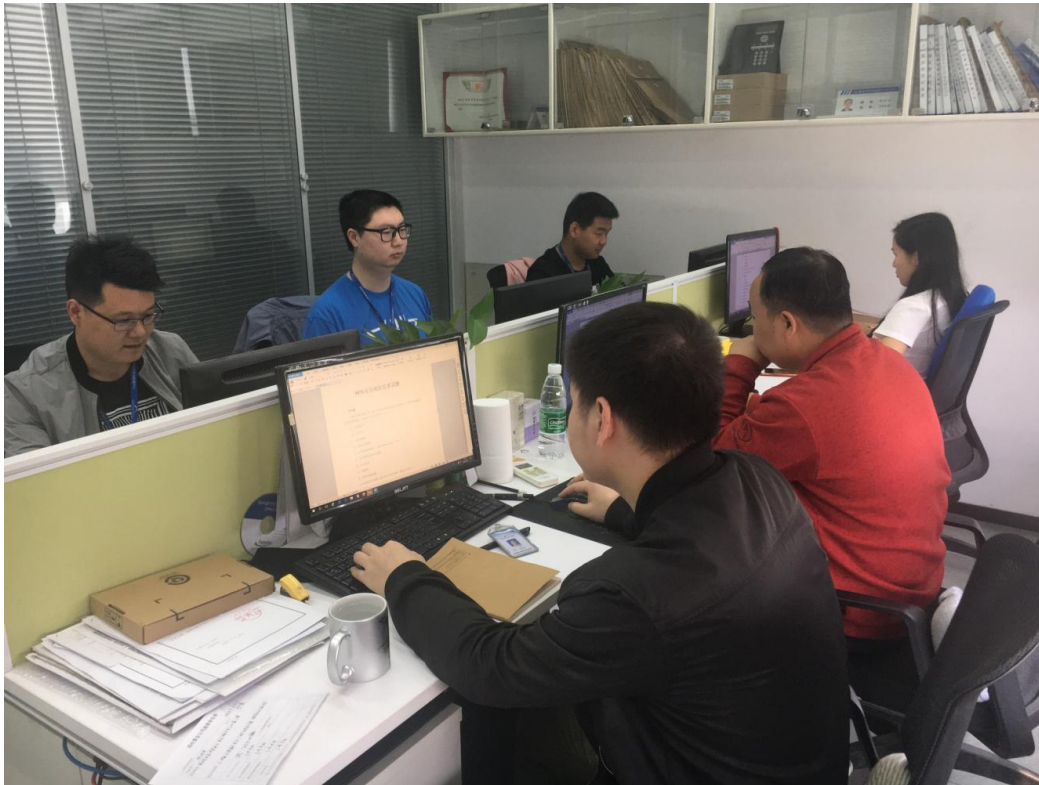
图 5. 郑州市景安网络科技有限公司网络安全技能大赛初赛现场