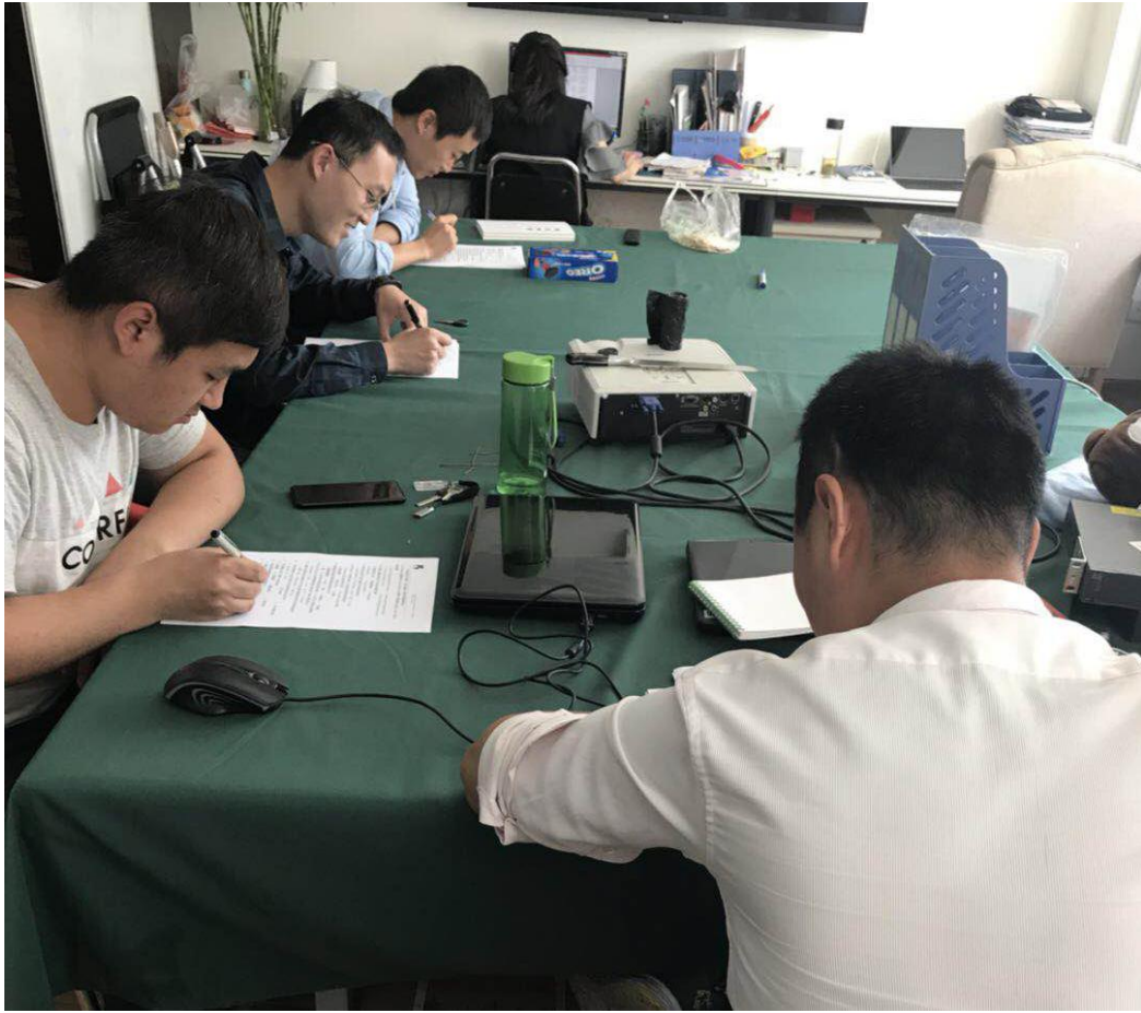
图 7. 河南数安科技有限公司网络安全技能大赛初赛现场