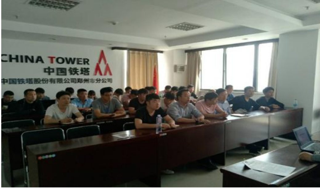
图 4. 中国铁塔股份有限公司河南省分公司组织网络安全技能培训